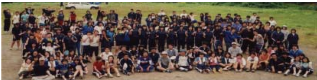
(平成14年度全校キャンプ 酸ヶ湯キャンプ場)

学校と地域が協力した全校的ボランティア活動を中心に、多くの人々と出会う機会を通じて、広い視野と豊かな発想が育つように活動しています。また、幼児ふれあい体験や救急救命講習会など体験的学習の機会も多く取り入れています。