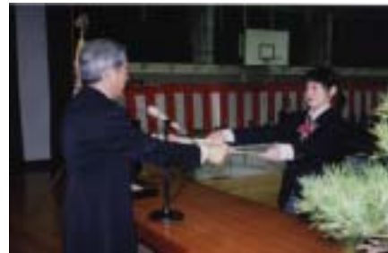
(平成14年度卒業証書授与式)

また、本校は普通科ですが情報処理、ワープロ実習を取り入れた授業を行っており、全員検定合格を目標にしています。さらに、英語検定をはじめ、漢字能力検定、硬筆書写検定、危険物取扱者(乙種・丙種)など、多くの資格取得を目指し取り組んでいます。